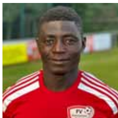
Unison Dama Mittelfeld · RN: