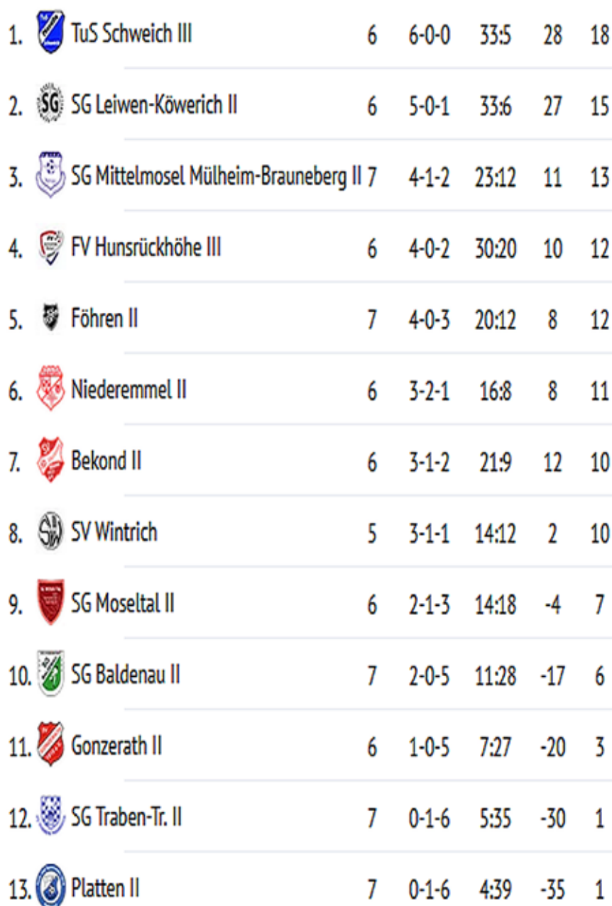
Tabelle Kreisliga C 20 - 2023/24