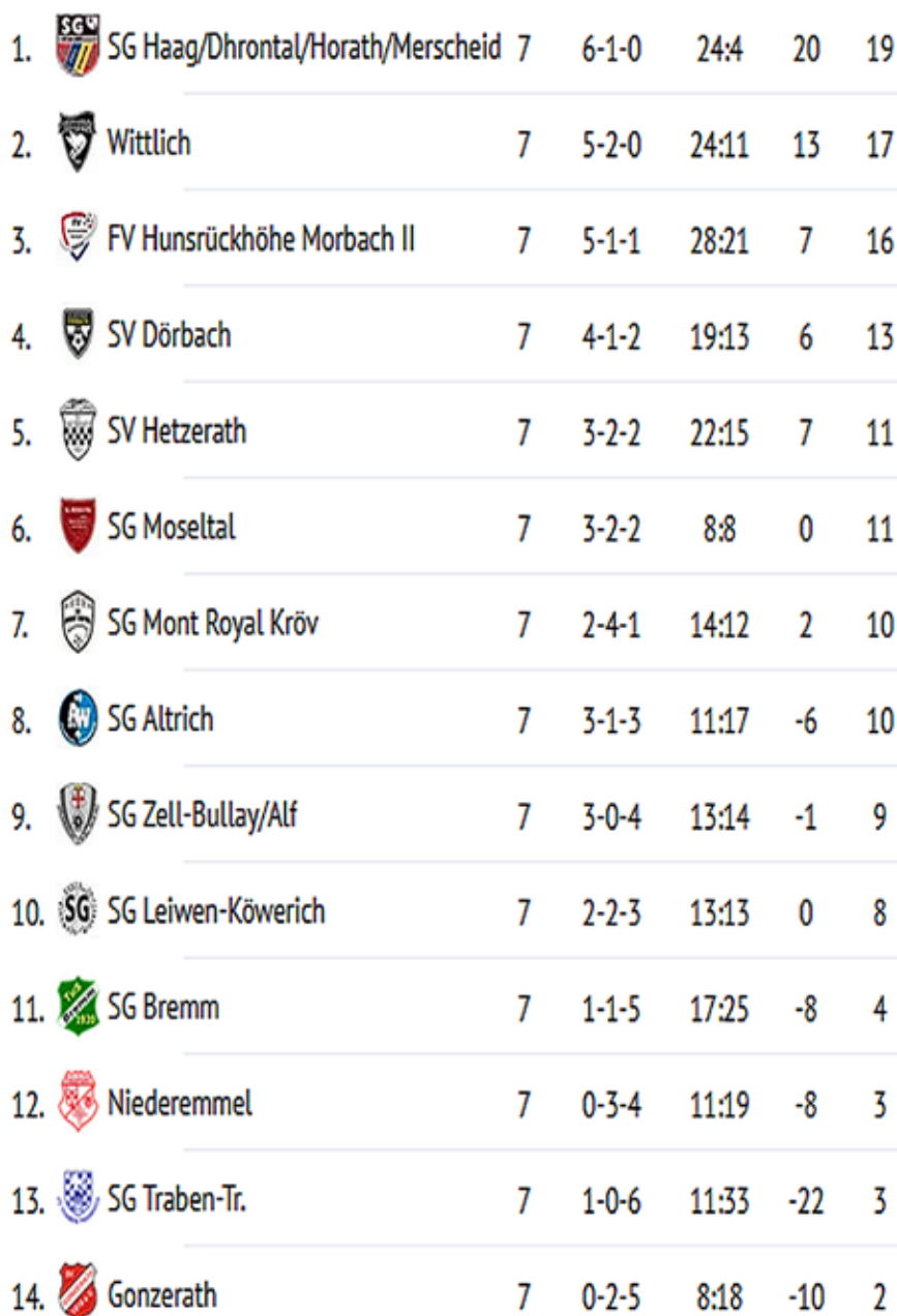
Tabelle Kreisliga A 8 - 2023/24