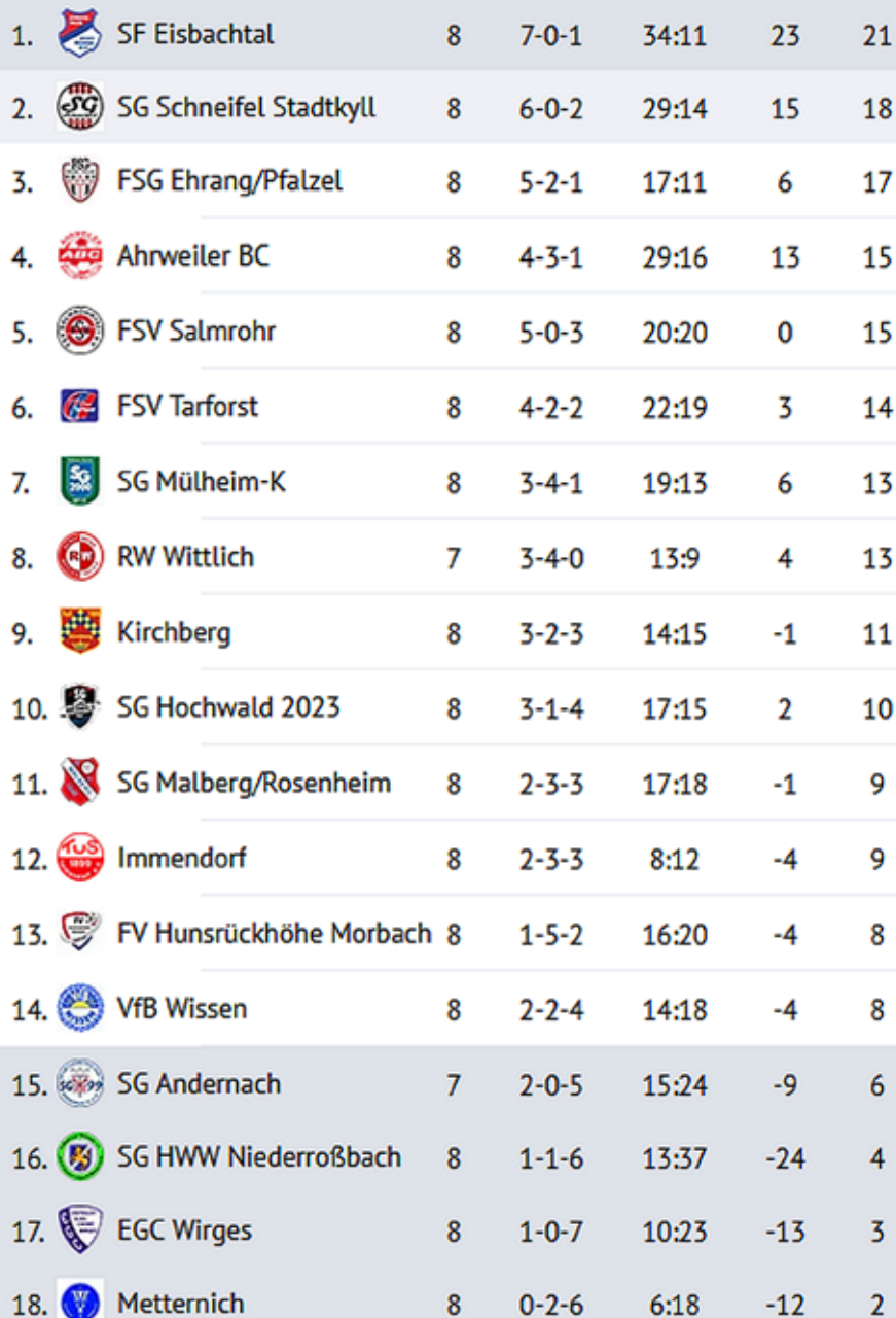
Tabelle Rheinlandliga - 2023/24