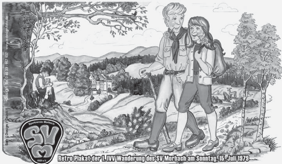
Retro Plakat der 1. IVV-Wanderung des SV Morbach am Sonntag, 15. Juli 1979