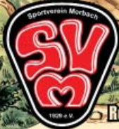
Retro Plakat der 1. IVV Wanderung des SV Morbach am Sonntag, 15. Juli 1979